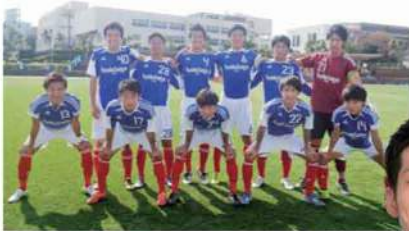
サッカー部の部員たち