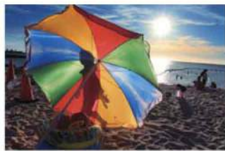
普天間さんの作品「Sunset」

若手写真家の発掘と育成を目的に創設された「第16回上野彦馬賞 -九州産業大学フォトコンテスト-」の表彰式を、昨年11月1日(日)に行いました。