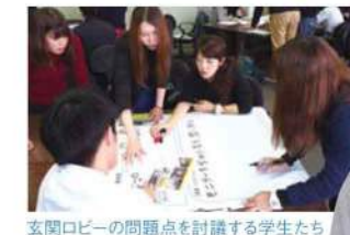
玄関ロビーの問題点を討議する学生たち