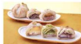
試作を重ねた自信作「博多このみパイ」