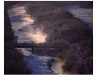
惠原さんの作品「けあらしの朝」