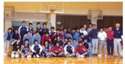
バスケットボール部の部員たち